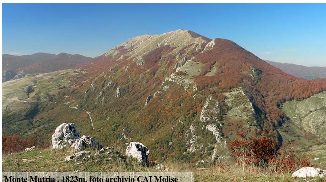
Monte Mutria, 1823m

In collaborazione con la Sezione CAI di Campobasso