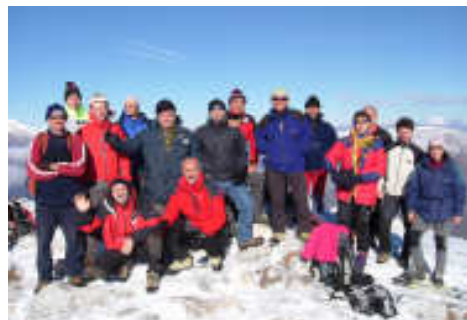
In vetta al Monte Nuria, 6 Gennaio 2007