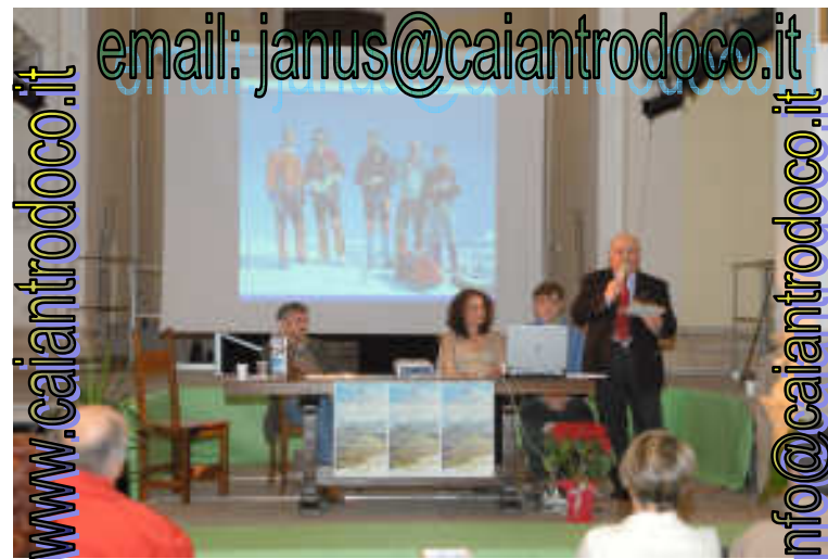
In copertina: Salita al Monta Calvo 1898m, con le ciaspole