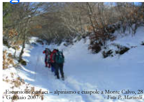
Escursione con sci - alpinismo e ciaspole a Monte Calvo, 28 Gennaio 2007