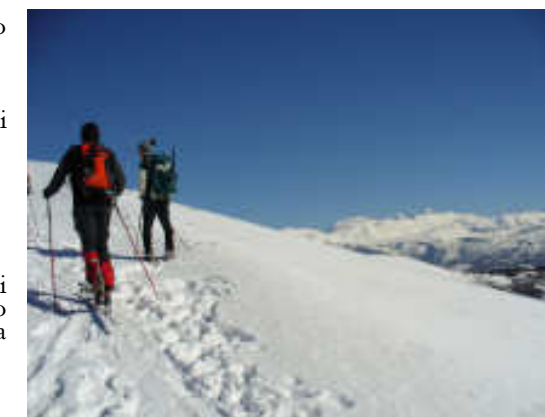
Escursione con sci – alpinismo e ciaspole a Monte Calvo, 28 Gennaio 2007

Informazioni e tabelle sono state tratte dalla dispensa didattica: Corso di qualifica EAI, del Club Alpino Italiano, Commissione Regionale per l'Escursionismo, Convegno Trentino Alto Adige (T.A.A.), CAI-SAT del 30/12/2003.